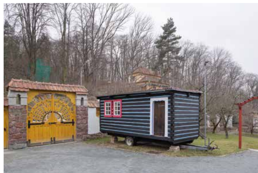
1 ANNA TRETTER: Na ceste – Malé domčeky autobusových zastávok, 2004/2018, inštalácia (digitálna prezentácia fotografií a kresba na stene), variabilné rozmery, majetok autorky, foto: archív autorky